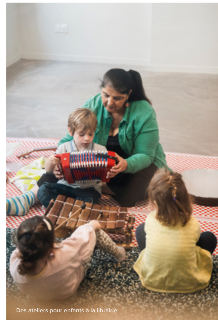
Des ateliers pour enfants à la librairie

Le Poisson Lune fait partie des structures qui ont été associées à l'organisation de Quartier livre, aux côtés de tous les professionnels du coin volontaires : librairies (La Touriale, La Rêveuse, Nozika), éditeurs, auteurs, bibliothèques, associations, centres sociaux, citoyens... Une démarche collective qui illustre un autre aspect du projet municipal : le désir de faire avec les acteurs culturels, tout en les aidant à se développer. Ainsi, outre les événements auxquels ils sont associés, une multitude de dispositifs leurs sont destinés : appels à projets pour des résidences au HangArt et à Hyperion, accompagnement des structures dans leurs projets ou leur recherche de financements, prêt de locaux, etc. Avec, derrière, la conviction que la culture permet de partager, d'échanger des idées, de s'exprimer, de grandir... Et qu'elle est donc au cœur des missions du service public. ●