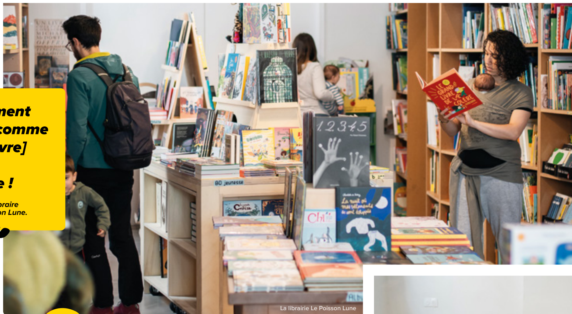
La librairie Le Poisson Lune

Il salue aussi le lancement en novembre 2024 de Quartier livre, festival qui propose aux professionnels du secteur de programmer des activités pour tous les âges : rencontres, ateliers, balades littéraires... « Un événement littéraire de ce genre manquait à Marseille ! », note-t-il..